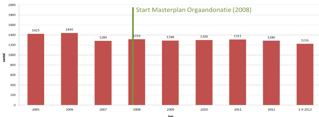
Wachtenden op een donororgaan * 2005 tot 1 sep 2013

* Hierboven is de actieve wachtlijst weergegeven. De actieve wachtlijst is de lijst met mensen die een transplantatie nodig hebben en deze, vanuit medisch perspectief, ook direct zouden kunnen ondergaan. De inactieve wachtlijst van mensen die een complicatie hebben, ziek zijn of op vakantie zijn, is aanzienlijk groter. De daling van de actieve wachtlijst is niet direct te verklaren. Het aantal postmortale donoren en de daaruit volgende transplantaties dalen licht t.o.v zelfde periode 2012. De groei in donaties bij leven compenseert die afname nog niet eens voor de helft.