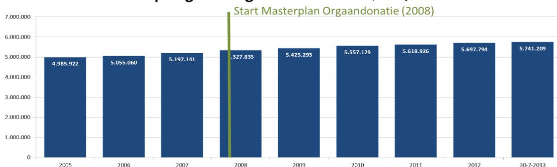
Aantal raadpleegbare registraties *** - 2005 t/m 31 juli 2013

*** Het aantal registraties neemt bijna in lijn met de groei van de Nederlandse bevolking toe. Het aantal registraties betreft iets meer dan 40% van de Nederlanders. Dit percentage neemt helaas ondanks alle moeite en initiatieven marginaal toe, hetgeen betekent dat ongeveer 60% van de bevolking geen keuze vast legt en dit overlaat aan de nabestaanden, die hiermee op een emotioneel en onmogelijk moment geconfronteerd worden. Alleen door te registreren heb je zelf het heft in eigen hand!