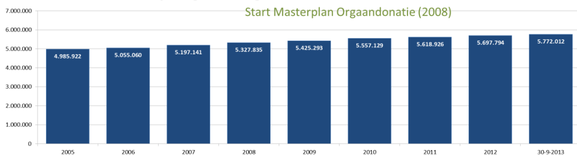
Aantal raadpleegbare registraties *** - 2005 t/m 31 nov 2013

*** Het aantal registraties neemt bijna in lijn met de groei van de Nederlandse bevolking toe. Het aantal registraties betreft iets meer dan 40% van de Nederlanders. Dit percentage neemt helaas ondanks alle moeite en initiatieven marginaal toe, hetgeen betekent dat ongeveer 60% van de bevolking geen keuze vast legt. In allerwaarschijnlijkheid Waarschijnlijk weet ruim de helft van deze zeven miljoen mensen niet dat nabestaanden dan moeten beslissen. Zij worden op een emotioneel en onmogelijk moment geconfronteerd met de donatie vraag. Alleen door te registreren heb je zelf het heft in eigen hand!