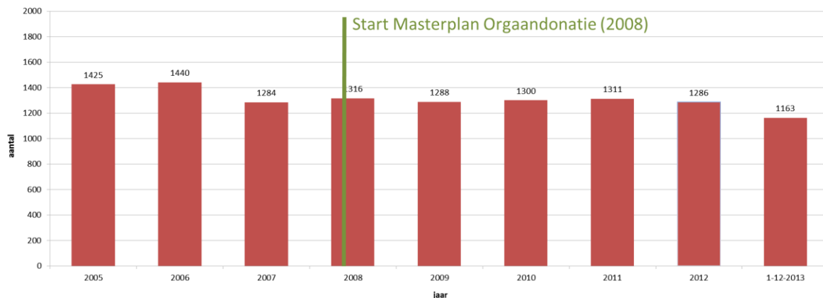
Wachtenden op een donororgaan * 2005 tot 1 dec 2013

* Hierboven is de actieve wachtlijst weergegeven. De actieve wachtlijst is de lijst met mensen die een transplantatie nodig hebben en deze, vanuit medisch perspectief, ook direct zouden kunnen ondergaan. De inactieve wachtlijst van mensen die een complicatie hebben, ziek zijn of op vakantie zijn, is aanzienlijk groter. De daling van de actieve wachtlijst is niet direct te verklaren. Het aantal postmortale donoren en de daaruit volgende transplantaties dalen t.o.v zelfde periode 2012. De groei in donaties bij leven compenseert die afname nog niet eens voor de helft.