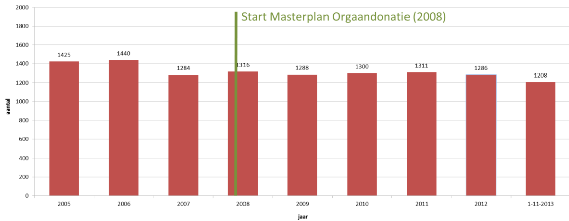
Wachtenden op een donororgaan * 2005 tot 1 nov 2013

* Hierboven is de actieve wachtlijst weergegeven. De actieve wachtlijst is de lijst met mensen die een transplantatie nodig hebben en deze, vanuit medisch perspectief, ook direct zouden kunnen ondergaan. De inactieve wachtlijst van mensen die een complicatie hebben, ziek zijn of op vakantie zijn, is aanzienlijk groter. De daling van de actieve wachtlijst is niet direct te verklaren. Het aantal postmortale donoren en de daaruit volgende transplantaties dalen t.o.v zelfde periode 2012. De groei in donaties bij leven compenseert die afname nog niet eens voor de helft.