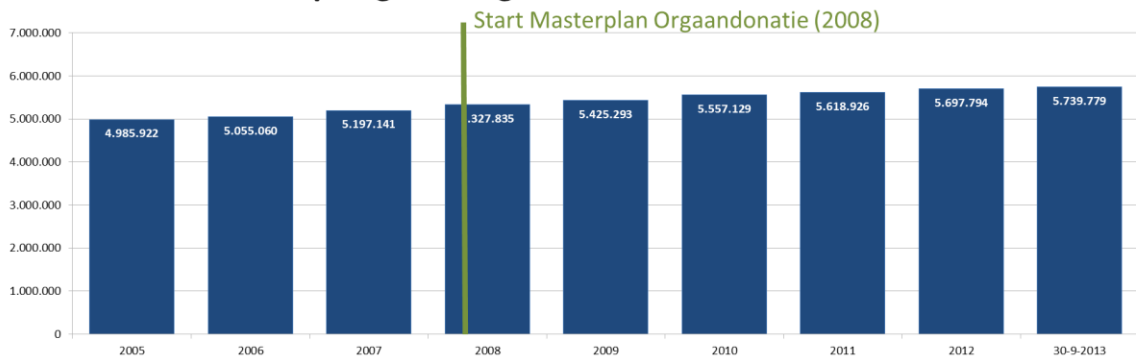
Aantal raadplegbare registraties *** - 2005 t/m 30 sep 2013

*** Het aantal registraties neemt bijna in lijn met de groei van de Nederlandse bevolking toe. Het aantal registraties betreft iets meer dan 40% van de Nederlanders. Dit percentage neemt helaas ondanks alle moeite en initiatieven marginaal toe, hetgeen betekent dat ongeveer 60% van de bevolking geen keuze vast legt. In allerwaarschijnlijkheid Waarschijnlijk weet ruim de helft van deze zeven miljoen mensen niet dat nabestaanden dan moeten beslissen. Zij worden op een emotioneel en onmogelijk moment geconfronteerd met de donatie vraag. Alleen door te registreren heb je zelf het heft in eigen hand!