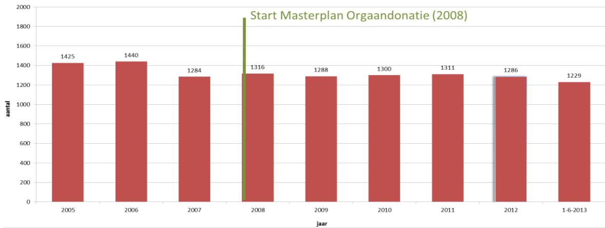
Wachtenden op een donororgaan * 2005 t/m 1 juli 2013

* Hierboven is de actieve wachtlijst weergegeven. De inactieve wachtlijst van mensen, die vanwege een complicatie of andere ziekte (nog) niet op de lijst komen/mogen, is 2 tot 3 keer groter. De lichte daling is met name te danken aan een toename van donatie bij leven (nier en incidenteel lever)