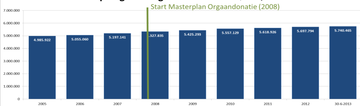
Aantal raadpleegbare registraties *** - 2005 t/m 30 juni 2013

*** Het aantal registraties neemt bijna in lijn met de groei van de Nederlandse bevolking toe. Het aantal registraties betreft iets meer dan 40% van de Nederlanders. Dit percentage neemt helaas ondanks alle moeite en initiatieven marginaal toe, hetgeen betekent dat ongeveer 60% van de bevolking geen keuze vast legt en dit overlaat aan de nabestaanden, die hiermee op een emotioneel en onmogelijk moment geconfronteerd worden. Alleen door te registreren heb je zelf het heft in eigen hand!