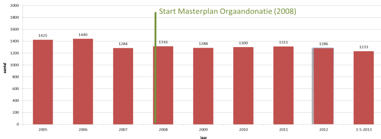
Wachtenden op een donororgaan * 2005 t/m 1 mei 2013

* Hierboven is de actieve wachtlijst weergegeven. De inactieve wachtlijst van mensen, die vanwege een complicatie of andere ziekte (nog) niet op de lijst komen/mogen, is 2 tot 3 keer groter.